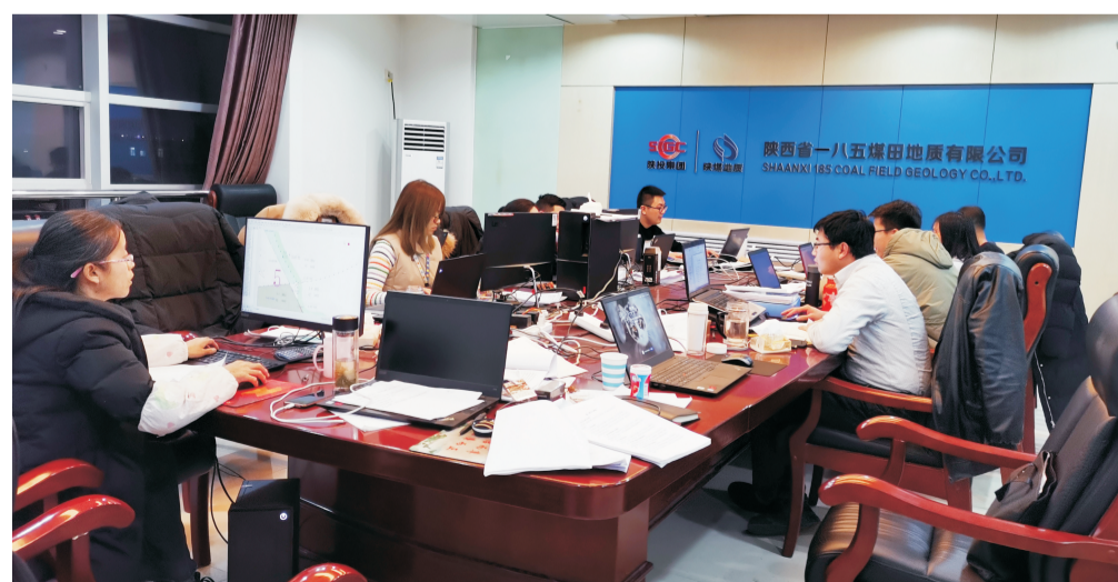
晚饭过后，职工依然留守在办公室编制报告，有时会坚守到零点以后