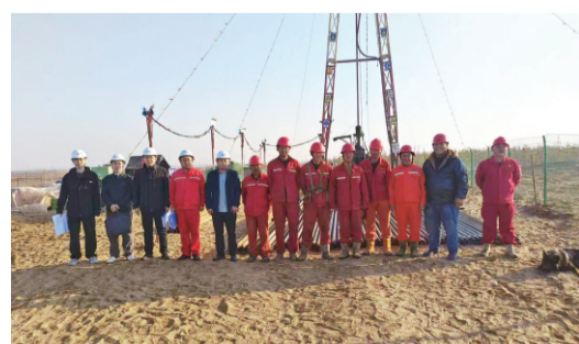
（图/文 关亚伟 罗腾文）

该项目位于内蒙古鄂托克前旗上海庙镇，设计钻孔7个，工程量预计8300多米；该项目由地质工程勘察院承担，项目负责组织野外机组进行安全生产培训，宣贯管理制度及安全、技术专项措施，以确保该项目高质量、高效率推进。