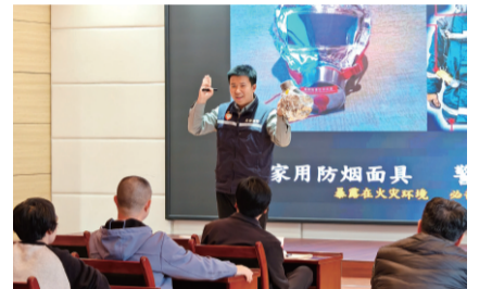
（文/任福建）

在演练阶段，马老师对室内消防栓的操作使用进行了详细讲解，手把手的进行实操训练。在室外进行灭火扑救，分别就干粉、水基、二氧化碳等不同灭火器的使用进行了重点讲解，并指导员工和家属进行灭火操作，本次培训有效提升了员工消防安全意识，强化了火灾应急处置能力，把消防安全“四懂四会”传播到每个家庭，切实做好全民消防安全工作。