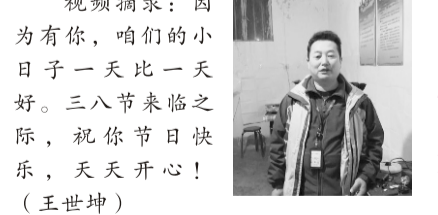
视频摘录：因为有你，咱们的小日子一天比一天好。三八节来临之际，祝你节日快乐，天天开心！(王世坤)