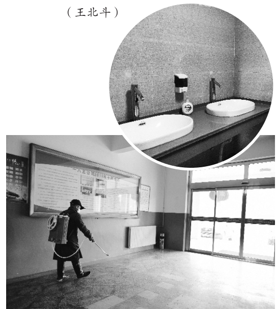
正在为办公区域进行消毒