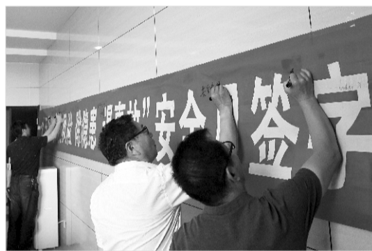
举行安全生产承诺签字仪式