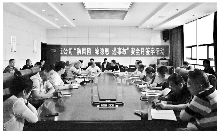
召开安全生产月动员会

三是开展安全隐患大排查，做到“零容忍”。对公司进行一次全面彻底的安全检查、事故隐患排查。以