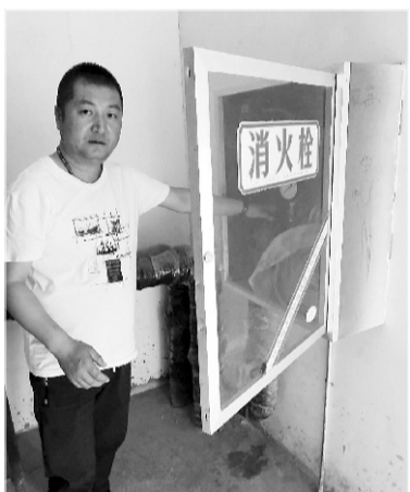
开展安全隐患排查

为牢固树立安全发展理念，防范化解重大风险、及时消除安全隐患、有效遏制生产安全事故，增强全体干部职工安全生产意识，提升安全素质，强化安全管理措施，落实安全责任，公司于6月份开展以“防风险、除隐患、遏事故”为主题的2019年“安全生产月”活动。