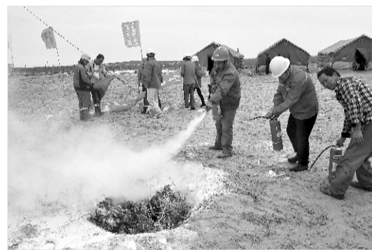
开展消防灭火演练

本次“安全生产月”活动形式多样、内容丰富且具有实效。做到营造良好的安全文化氛围，夯实公司安全生产标准化、精细化管理基础，促进安全生产管理水平提升和安全生产形势持续稳定向好发展。