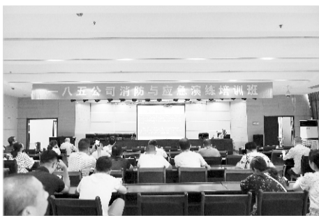
举办消防与应急演练培训班