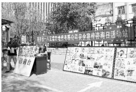
开展“安全生产咨询日”志愿宣传活动